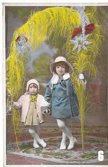
(6) Fotografia acolorida a mà de dues nenes amb palmons.