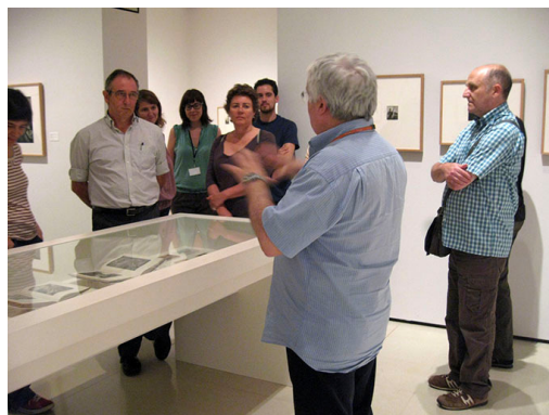
Visita guiada al MNAC

-19 de juny: Visita guiada a la Secció de Fotografia del MNAC , i a l'exposició temporal Nord d'Àfrica d'Ortiz Echagüe , a càrrec de David Balsells, Conservador en Cap de Fotografia del MNAC. Activitat organitzada pel MNAC i Fotoconnexió.