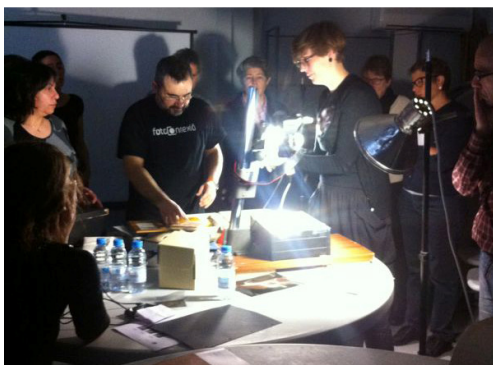
Museu Marítim de Barcelona, 20 i 27 d'abril