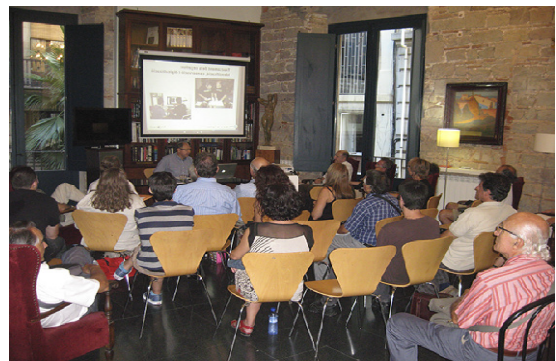
Fototertúlia del 5 de setembre