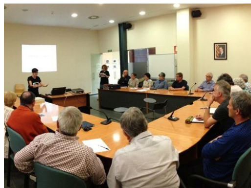
Arxiu Comarcal del Pallars Jussà, el 5 i 6 de juny