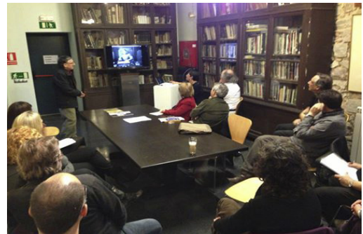
Fototertúlia del 4 d'abril