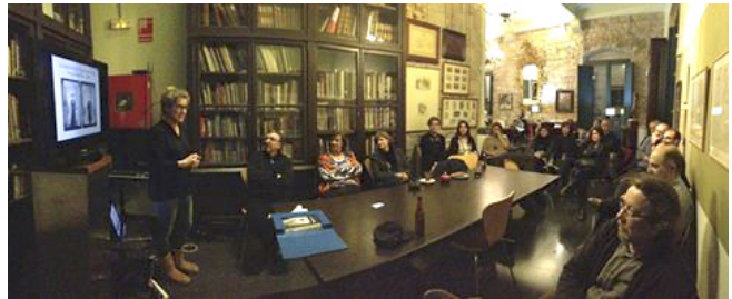
Fototertúlia del 7 de març

Les tertúlies és el punt de trobada dels socis per intercanviar opinions, coneixements, experiències, etc. En algunes ocasions, un soci o convidat ofereix una xerrada o conferència sobre algun tema relacionat amb la fotografia.