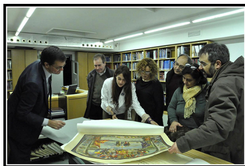
Visita guiada al Centre d'Oftalmologia Barraquer