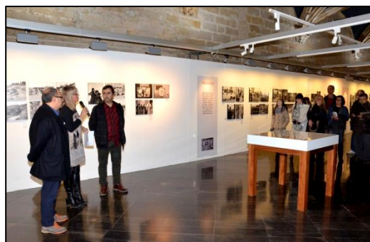
Inauguració de l'exposició de Boix a Lleida.