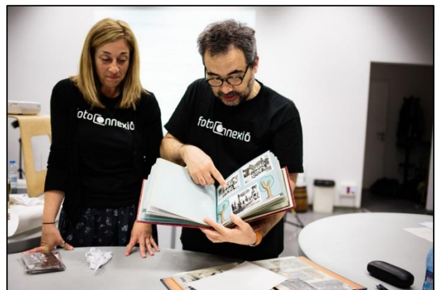
"Fotos en conserva", Museu Marítim de Barcelona.