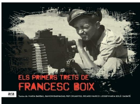
Portada del llibre editat per Ara Llibres a partir de la idea original de Fotoconnexió

L'exposició i el llibre han estat motiu d'atenció per part de la premsa generalista, amb una molt bona crítica (Ara, 4 de desembre; El Punt-Avui i Segre el 16 de desembre; i el Periódico, 18 de desembre).