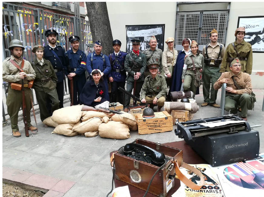
El grup de recreació històrica a la Biblioteca Francesc Boix del Poble-sec.