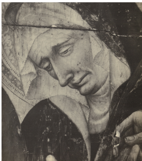
Detall d'una pintura de Lluís Borrassà (1410). Museu de Manresa. Imatge continguda a Le sauvetage du patrimoine historique et artistique de la Catalogne. [?]: Comissariat de Propaganda de la Generalitat de Catalunya, 1937.