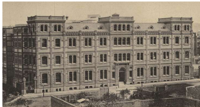
Establiment dels Sucesores de Narciso Ramírez y C.ª, després Henrich y C.ª, al carrer Còrsega. Calendario para el año 1888 .

Al llarg d'aquest període, el nombre d'establiments d'impremta i de litografia a Barcelona va experimentar un increment sense precedents.