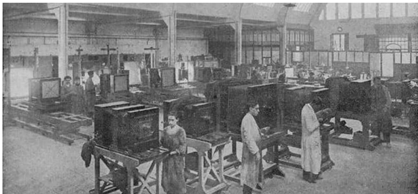
Interior de la Unión de Fotograbadores. Barcelona artística e industrial , 1917.

A partir de l'últim terç del segle XIX, doncs, el sector de les arts gràfiques no estarà format només per impremtes i per litografies, sinó que els procediments fotomecànics aniran trobant el seu lloc per erigir-se en una part fonamental. I aquest fet es veu reflectit en els anuncis de l'època, que recullen tota una nova iconografia que incorporarà la fotografia com a part integrant de les arts gràfiques.